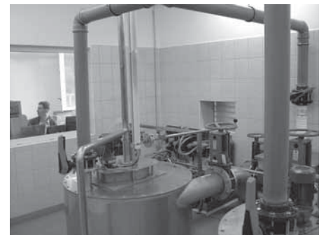
Megkezdődött a hegyesdi szennyvíztisztító telep műszaki átadása