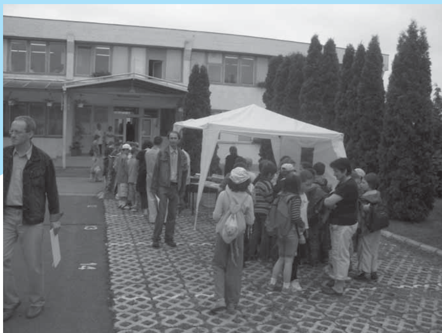
A Veszprémi Üzemmérnökség központi telepén, a Nyílt napra berendezett bemutatót a város 20 oktatási intézményéből összesen mintegy félezer fiatal – óvodástól középiskolásig – látogatta meg