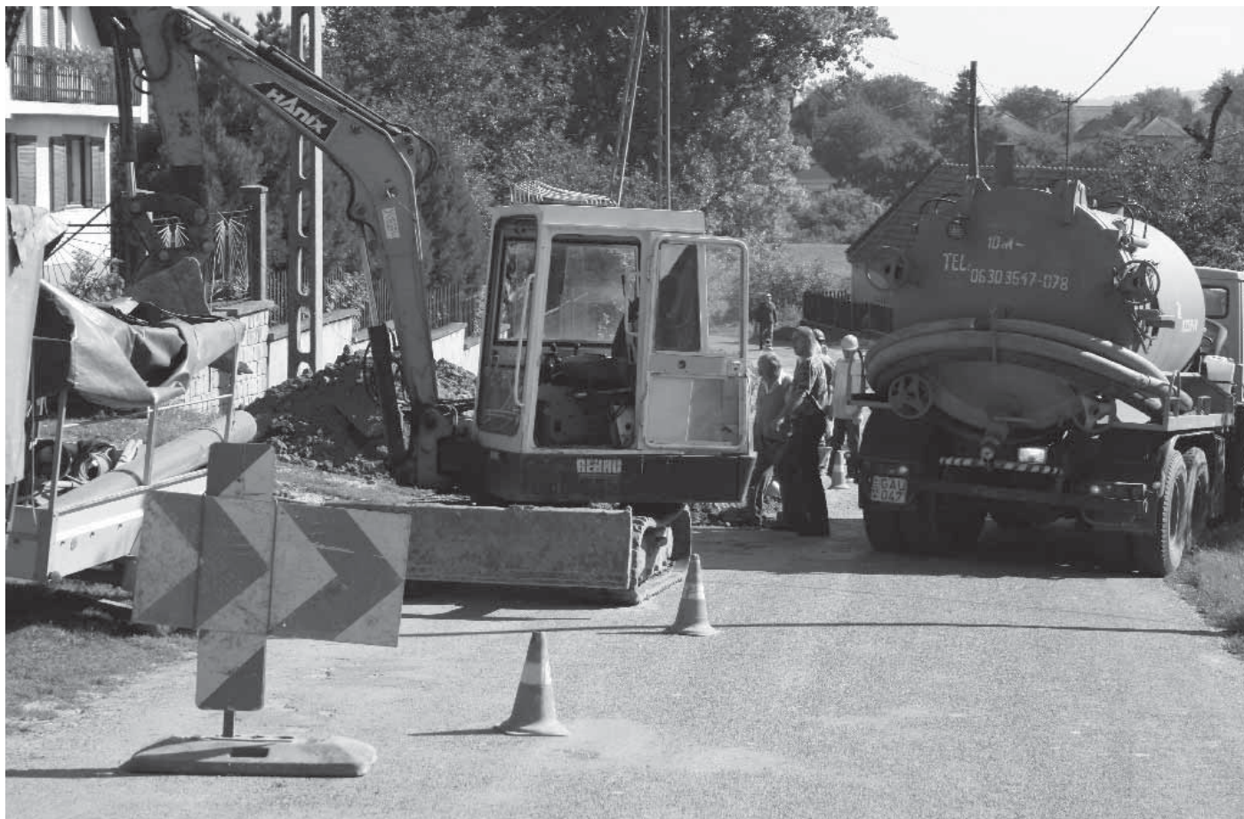
2008-ban is folytatódik az eddig ellátatlan területek csatornázása.

A közterületbontás és forgalomkorlátozás nehézségei miatt hangsúlyosabbak a komplex közmű rekonstrukciós (ivóvízvezeték, szennyvíz- és csapadékcsatorna) munkálatok. Kiemelt példa erre a veszprémi Kohéziós Alap projekt 2. üteme (KA2), melynek keretében jelentős szennyvízcsatorna rekonstrukció valósul meg. Ehhez kapcsolódóan, a csatorna rekonstrukcióval érintett utcákban, hibastatisztikánkra alapozva, az ivóvíz-vezetéki rekonstrukciót is végrehajtjuk.